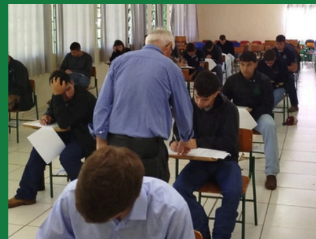
CEDUP de Campo Erê

As entidades, ATASC e SINTAGRI, participaram ativamente das etapas de organização e alinhamento da avaliação junto ao CONEA, e reafirmam seu compromisso com a qualidade do ensino técnico agrícola em Santa Catarina, fortalecendo a formação profissional e valorizando a categoria em todo o estado.