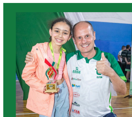
Atleta mais jovem do JETASC 2025

Diretoria de Cooperativismo e Desenvolvimento Rural da Secretaria de Estado da Agricultura e Pecuária de Santa Catarina.