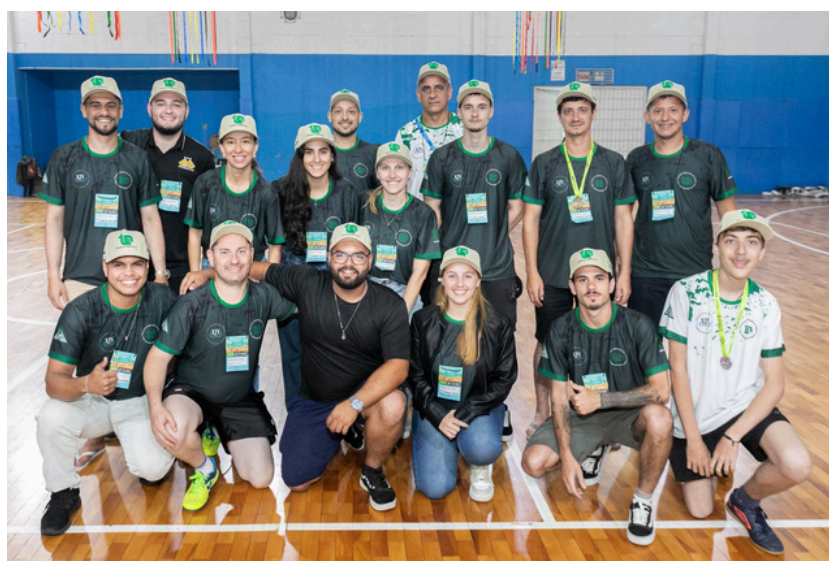
Coordenadores de Modalidades do JETASC.

Desde o planejamento inicial, organização dos espaços, levantamento de orçamentos, estruturação das atividades, comunicação, produção de materiais, montagem documentos, posts e vídeos, credenciamento, recepção dos participantes, até os inúmeros detalhes que muitas vezes não aparecem, mas fazem toda a diferença. Cada ação foi realizada com compromisso, espírito de equipe e, acima de tudo, amor pela profissão.