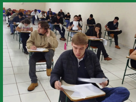
CEDUP Getúlio Vargas, de São Miguel do Oeste